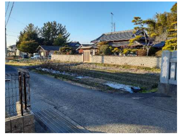
旧既存宅地+農業従事者で購入の場合